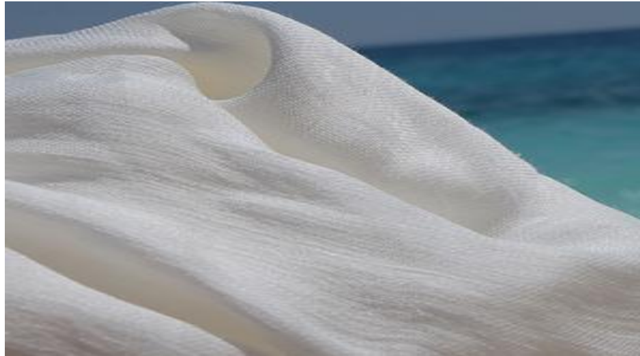
Anexa 5. Borangic (țesătură groasă de mătase):